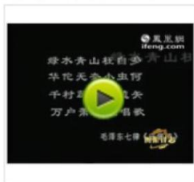
凤凰卫视:毛泽东《送瘟神》