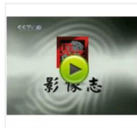
血吸虫肆虐半个中国:毛泽东